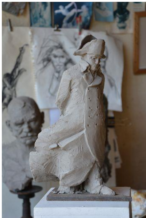
La maquette de la statue de Napoléon, réalisée par Emmanuel Michel.